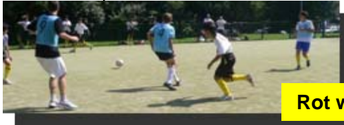
Rot weiss Essen 柿沼、鷹野、政洋、悠樹、上田チーム