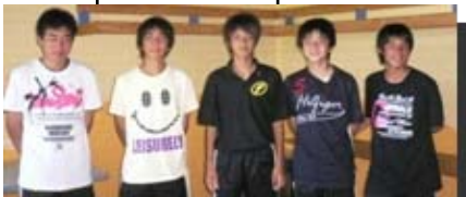
Wuppertaler 小池、中込、込山、高木、田中チーム