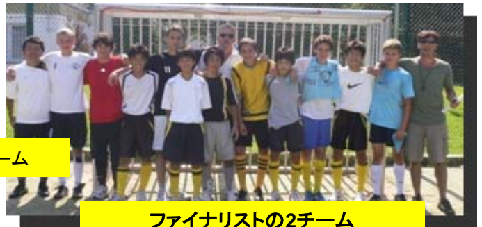
ファイナリストの2チーム