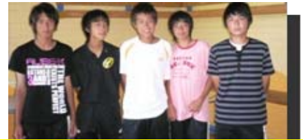
Fortuna Dusseldorf 小俣、對馬、一樹、石原、大地チーム