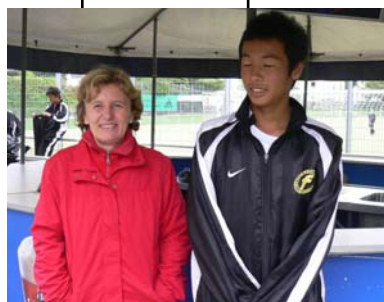
Familie Kauffeld mit Kawasaki