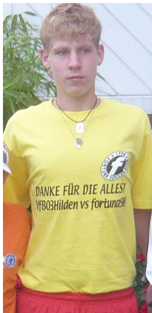
今回、記念のTシャツを作成して持って行き、ホームステイ先の家族に渡しました。黄色のエフのTシャツがドイツでもふえるといいな～。